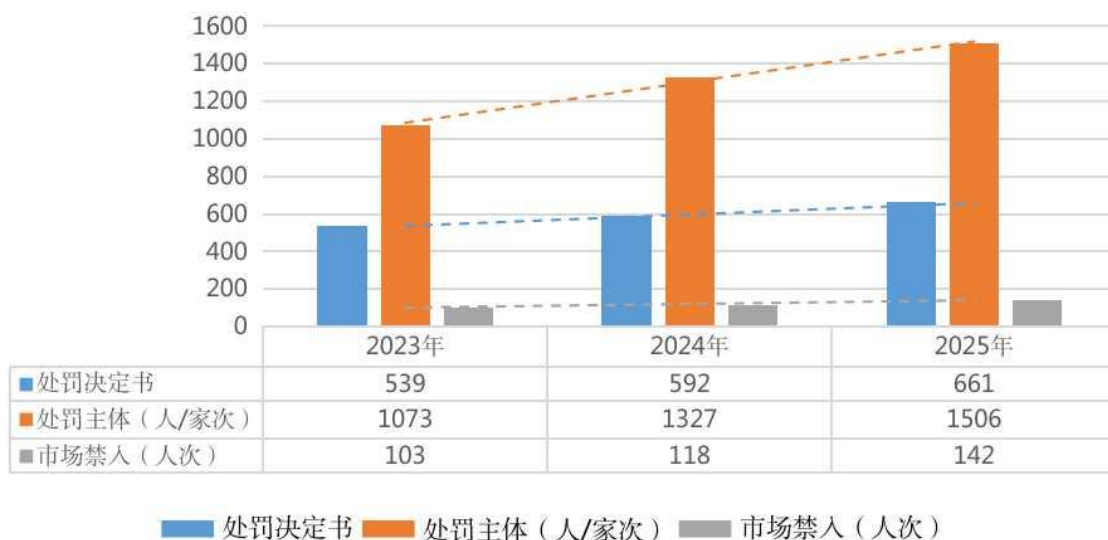
近三年中国证监会行政处罚情况